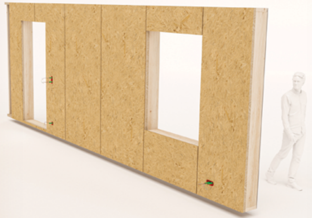
2D Parts - Cloisons